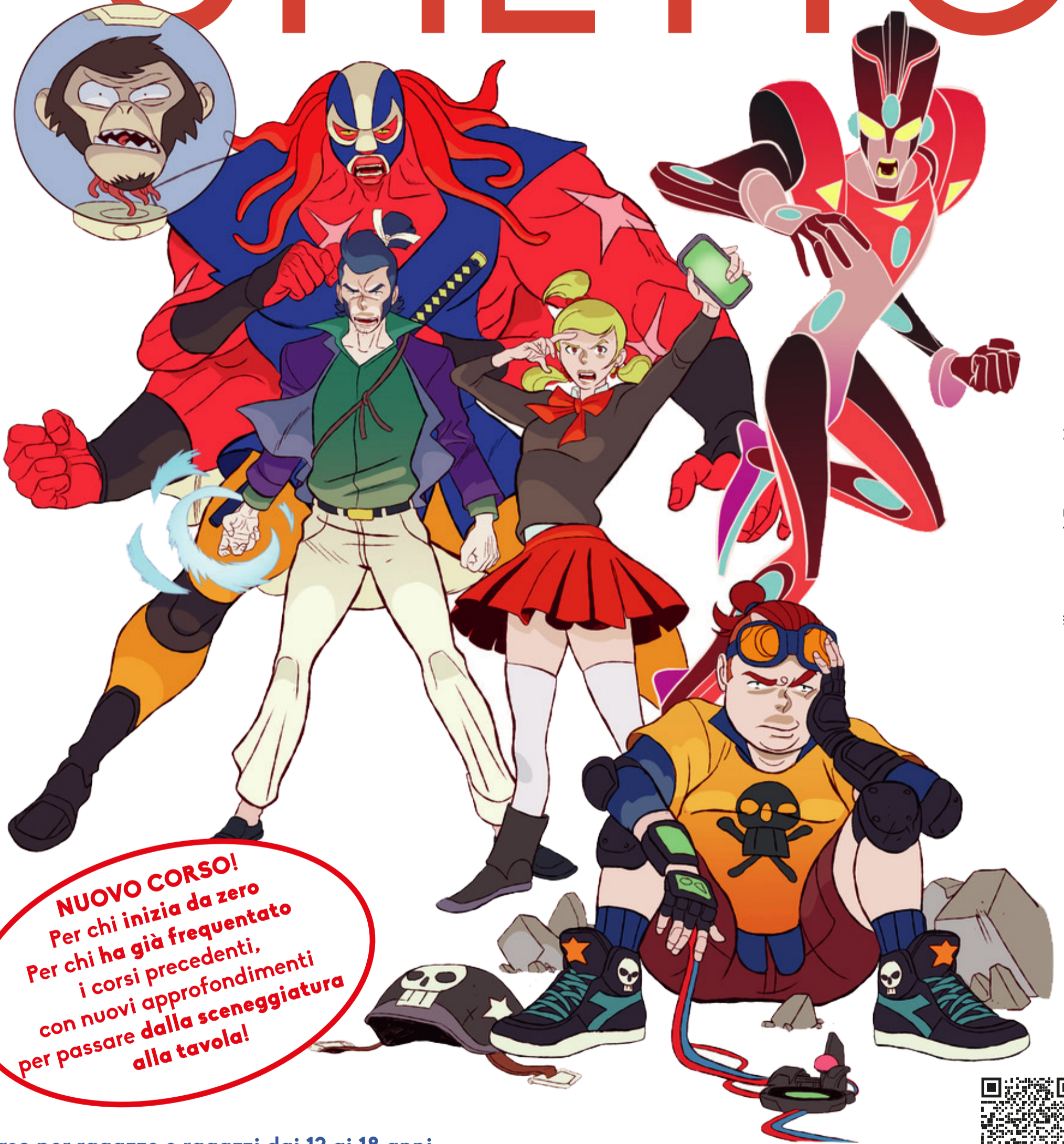
Illustrazione di Francesco Mortarino

NUOVO CORSO! Per chi inizia da zero Per chi ha già frequentato i corsi precedenti, con nuovi approfondimenti per passare dalla sceneggiatura alla tavola!